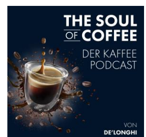
„The Soul of Coffee“ – der Kaffee-Podcast von De'Longhi